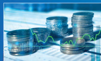
Novo salário mínimo e orientações Pg. 04