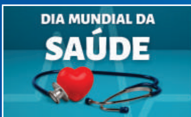
07 de abril - Dia Mundial da Saúde Pg. 03