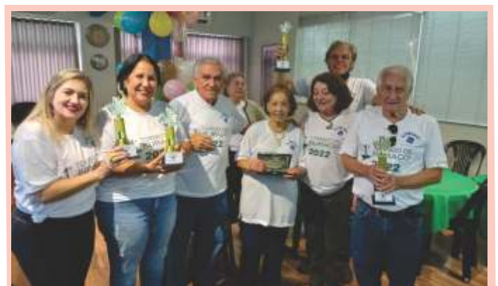
Torneio de Buraco da AJUBEMGE