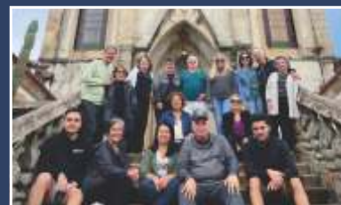
Viagem ao Caraça Pg. 05